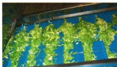
Ultrascreen bånd med medbringere